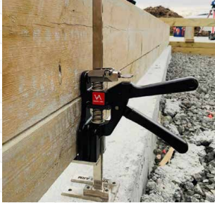
Lift, level and hold heavy objects. Levez, mettez à niveau et maintenez des objets lourds.

Installez des portes, des fenêtres, des armoires, des revêtements de sol, des terrasses, des systèmes CVC et des installations électriques rapidement et facilement. Laissez Viking Arm vous aider à transporter des meubles de salle de bain lourds, des cabines de douche, des portes en verre, des parois en verre, des tuyaux et des pompes. Vous construisez une maison ? Vous allez adorer l'utiliser pour les charpentes, les ajustements de poutres, les arcades et des centaines d'autres utilisations. Les travaux de construction et d'installation n'ont jamais été plus faciles.