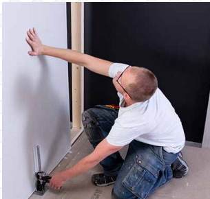
Install dry walls, panels and glass or stone walls. Installer des cloisons sèches, des panneaux, des murs en verre et en pierre.