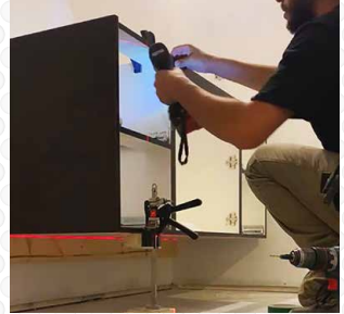
Hold, install and level storage units, HVAC equipment and more with extreme precision. Maintenir en place, installer et niveler les unités de rangement, l'équipement de HVAC et autres avec une précision extrême.