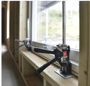
Install windows, framework and structural support. Installez les fenêtres, les charpentes et les supports structurels.