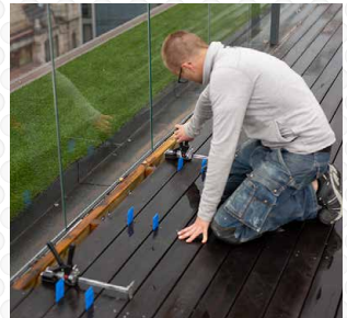
Build decks, porches, patios and more with ease. Construisez facilement des terrasses, des vérandas, des patios et bien plus encore.