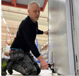
Install doors, gates and fences with ease. Installer facilement des portes, des portails et des clôtures.