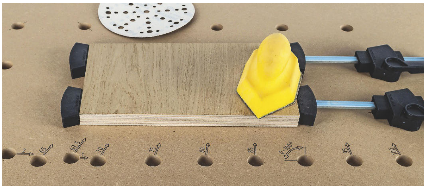
/ Winkel lassen sich über die gut sichtbaren, gelaserten Winkelangaben an den Löchern und den eigens dafür konzipierten Bankhaken schnell sowie ohne Messen einstellen.

Sauter stellt Multifunktionstisch Vario-Bench vor