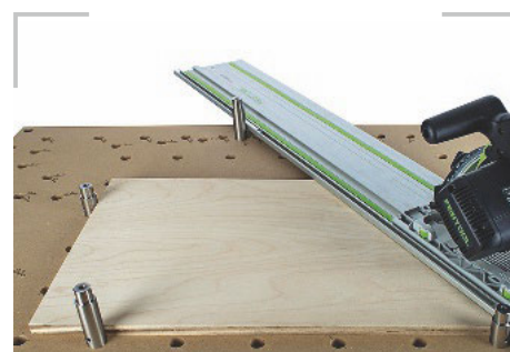
/ Die eigens für die Vario-Bench konzipierten Bankhaken sind exakt auf die Bohrungen abgestimmt.