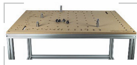
/ Das optional erhältliche Untergestell aus Systemprofilen erweitert die Funktionalität des Zubehörs.